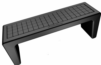
BORDILLO. VISTA LATERAL